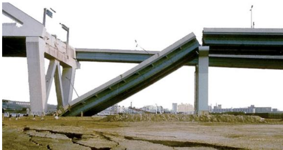
1.3-rasm. Kobadagi (Yaponiya, 1996 y.) zilzila vaqtida avtomobil yo'llari ko'prigining oraliq qurilmalarini qulashi

1996 y.) va Tayvandagi (1999 y.) zilzilalarni keltirish mumkin (1.3-1.4-rasmlar).