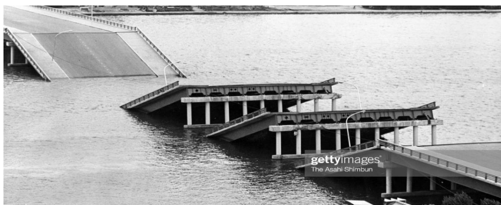
1.2-rasm. Shova-Ogashi (Niigata, 1964 y.) ko'prigini buzilishi

1.2-rasmda Niigatadagi (Yaponiya, 1964y.) 9-10 balli zilzila vaqtida Shova-Ogashi ko'prigini buzilish sxemasi keltirilgan. Ko'priklar bir qator bo'yicha joylashgan qoziqli tayanchlar, ikki tavrli po'lat to'sinli harakat qismi temir beton plitali uzlukli oraliq qurilmalardan iborat bo'lgan.