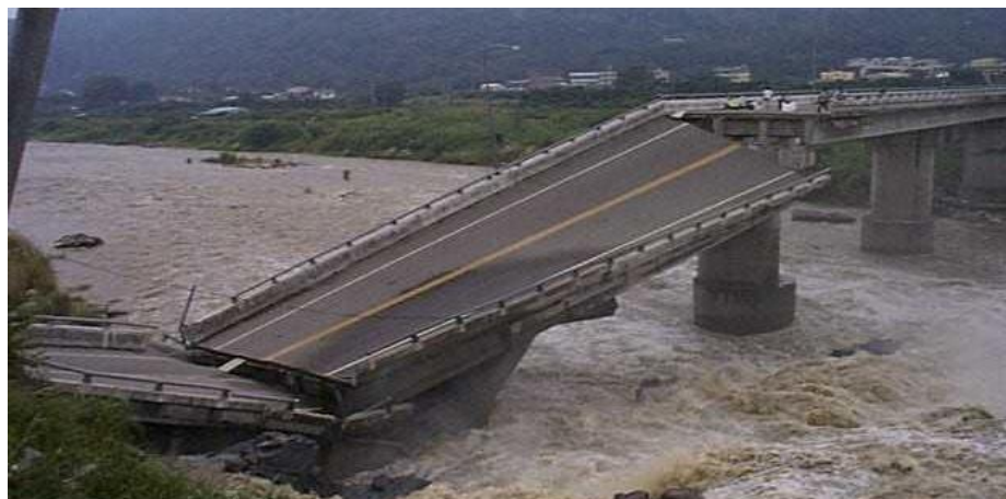
1.4-rasm. Tayvandagi zilzila oqibatlari (1999 y.)

Ko'prik tayanchlari ko'proq cho'kish va siljish kabi shikastlanishlarga chalinadi. Poydevor ostidagi grunt ma'lum darajada yumshoq bo'lganda, bunday shikastlanishga birinchi navbatda e'tibor qaratish zarur. Ko'prik har bir tayanchini cho'kish yoki siljish miqdori daryo o'zaning turli joylarida turlicha bo'lishi mumkin. Shuning uchun har bir joyda gruntlarning o'ziga xos xususiyatlarini e'tiborga olish kerak. Hatto bir qismi qattiq zaminda, ikkinchi qismi esa yumshoq zaminda turgan yakka tayanch bo'lganda ham inshoot anchagina og'ishiga olib keladigan notekis cho'kishga chalinishi mumkin. Misol tariqasida 1.4-rasmda zilzila vaqtida yirik ko'priklarning oraliq qurilmalarini qulashi va tayanchlarini shikastlanishi ko'rsatilgan.