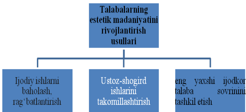
1.4-rasm. Talabalarning estetik madaniyatini rivojlantirish usullari

Talabalarning estetik madaniyatini rivojlantirib borish uchun quyidagi rasmda berilgan (1.4-rasm) usullardan foydalanishni tavsiya etamiz: