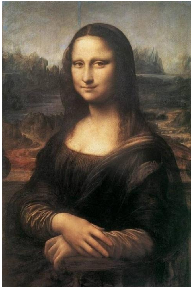
2-rasm. Leonardo da Vinchi “Mona Liza”