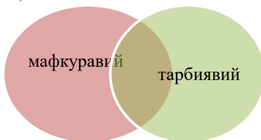
3-расм. Синфдан ташқари ишларни ташкил қилиш йўналишлари

Синфдан ташқари ишларни ташкил қилиш ишлари, асосан, 2 та йўналишда олиб борилади (3-расм).