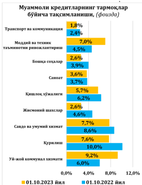
2-rasm. Muammoli kreditlarning tarmoqlar bo'yicha taqsimlanishi

Tijorat banklari kredit portfelidagi NPLning ulushi bo'yicha guruhlanganda 24 ta bankda 3 foizgacha (bank tizimi jami aktivlarida ulushi 40 foiz), 4 ta bankda 3,1 foizdan 5 foizgacha oraliqda (bank tizimi jami aktivlaridagi ulushi 43 foiz) va 7 ta bankda 5,1 foizdan yuqori bo'lib, ularning jami aktivlardagi ulushi 17 foizni tashkil etgan.