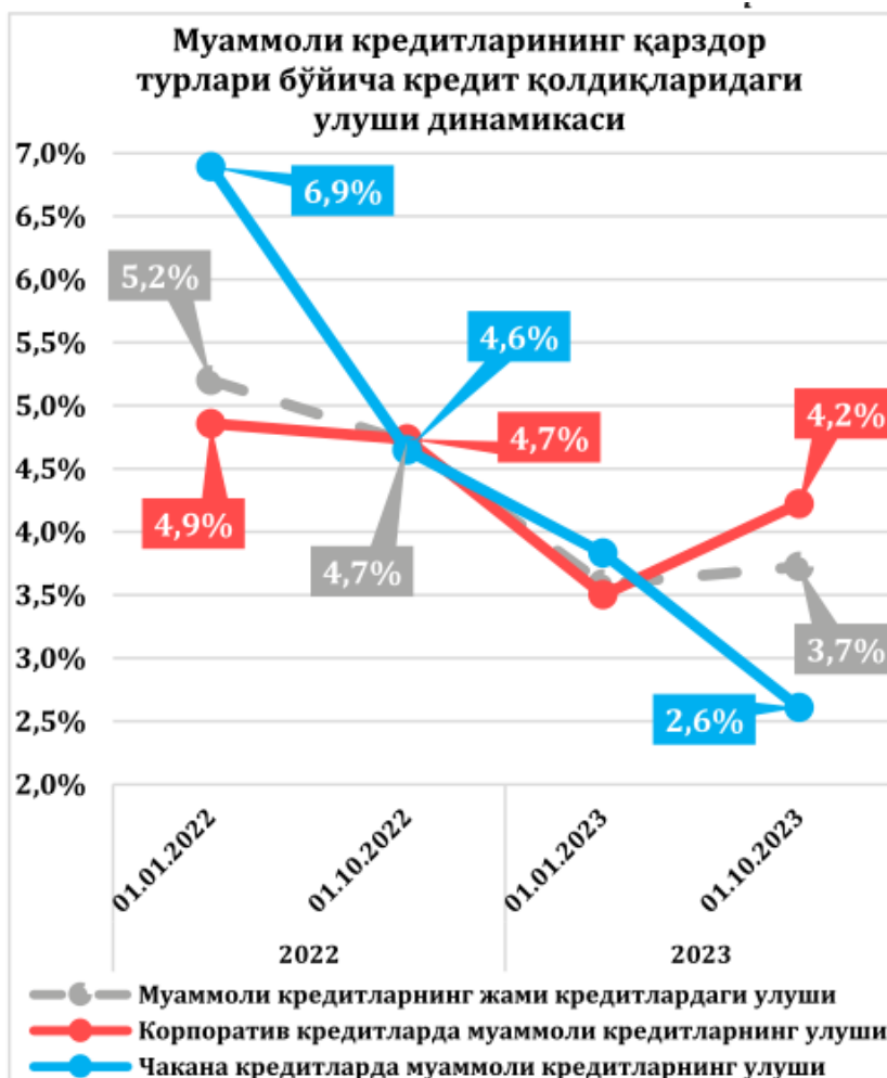
1-rasm. Muammoli kreditlarning qarzdor turlari bo'yicha kredit qoldiqlari turlari

Kredit qo'yilmalarida NPL ulushi tarmoqlar qirqimida uy-joy kommunal xizmat ko'rsatishda 9,2 foiz, savdo va umumiy xizmat sohasida 7,7 foiz, qurilish sohasida 7,6 foiz, qishloq xo'jaligida 5,7 foiz va sanoat sohasida 3,6 foiz darajasida shakllangan.